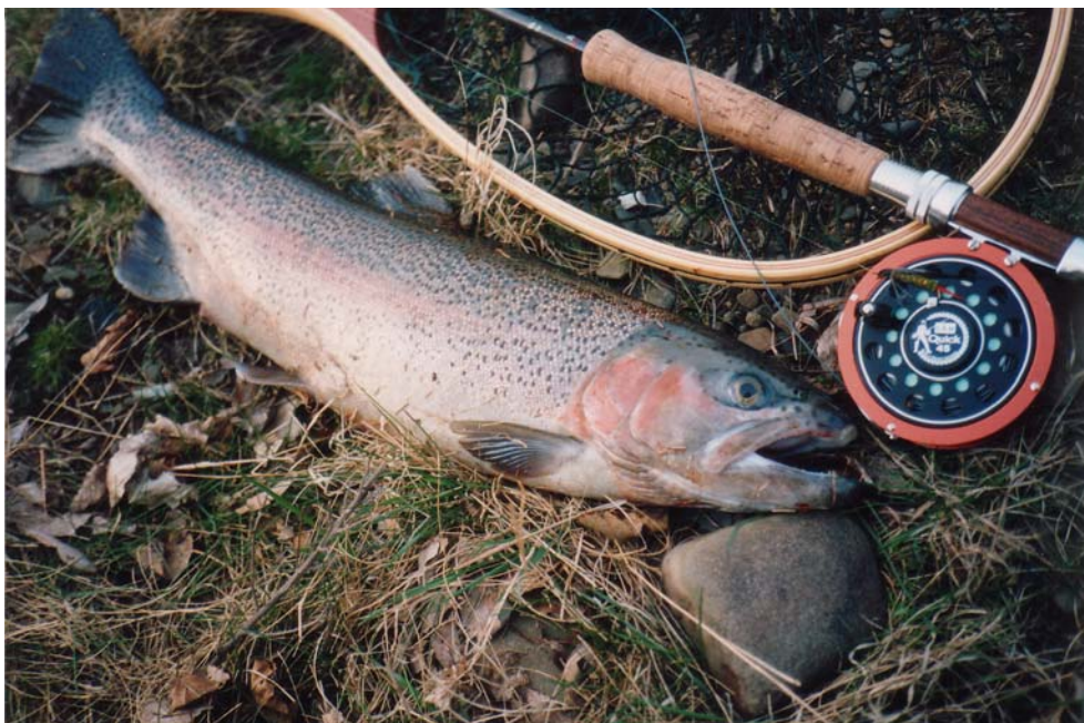
Forelle aus dem See Brockenblick

Maßgeblich sind die Bestimmungen in den Erlaubnisscheinen.