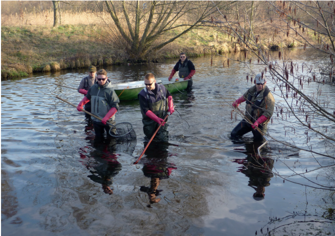
Elektrobefischung zur Bestandskontrolle

Die Mehrzahl der Naturschutzaktivitäten des ASV Braunschweig findet naturgemäß im und in der Nähe des Wassers statt. Auf dem Vereinsgelände in Wöltingerode befindet sich unsere extensive Fischzucht. Der Schwerpunkt liegt dabei auf der Zucht bedrohter Fischarten. Hierzu zählen neben dem atlantischen Lachs, Meer- und Bachforelle auch Karauschen und Aalquappen.