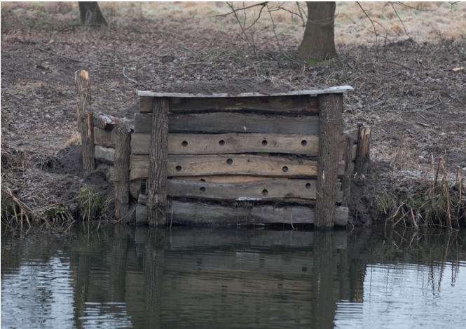
Eisvogel-Nisthilfe an der Oker bei Leiferde

Erfolgreich arbeitet der ASV Braunschweig bei der Renaturierung von Fließgewässern und der Biotopvernetzung mit.