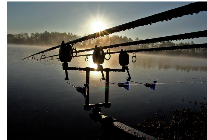
Abendstimmung in Vienenburg

Der Angelsportverein Braunschweig ist Mitglied im Anglerverein Niedersachsen e.V. (AVN), der ein anerkannter Naturschutzverein ist. Von den Mitgliedern des ASV Braunschweig werden jährlich bis zu 4000 Stunden ehrenamtlich für den Natur- und Gewässerschutz geleistet.