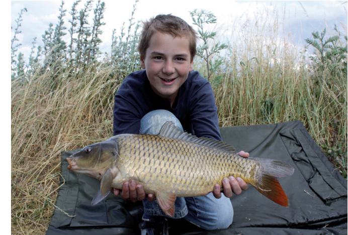
Jugendliche ab 12 Jahre lernen das Angeln unter fachkundiger Anleitung in der Jugendgruppe

Der Angelsportverein Braunschweig v. 1922 e.V. ist die älteste Vereinigung von Anglern in Braunschweig. Ausgehend von etwa 30 Mitgliedern im Gründungsjahr ist der Verein stetig auf heute etwa 1500 Mitglieder gewachsen.