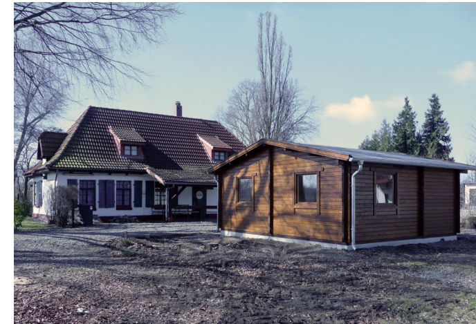
Vereinsheim und Fischerhütte in Wöltingerode

Das Vereinsheim des ASV Braunschweig v. 1922 e.V. liegt in landschaftlich reizvoller Lage in Wöltingerode bei Vienenburg/Harz auf dem Vereinsgelände. Hier befinden sich das Vereinsheim und die extensive Fischzucht. Die Angelgewässer sind nur etwa 600 m vom Vereinsheim entfernt. Das Vereinsheim bietet Übernachtungsmöglichkeit für etwa 12 Personen. Zusätzlich befindet sich auf dem Vereinsgelände noch eine Fischerhütte (Blockhaus) mit Übernachtungsmöglichkeit für 2 Erwachsene.