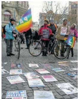
Rund drei Dutzend Teilnehmer starteten zu einem Fahrrad-Korso durch die Innenstadt.